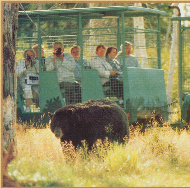
Les visiteurs sont en cage...

la faune locale est si riche que l'on ne regrette pas un seul instant l'absence des habituels pensionnaires africains ou asiatiques, confinés dans quelques mètres carrés ou enfermés dans des cages, avec l'ennui pour seul compagnon.