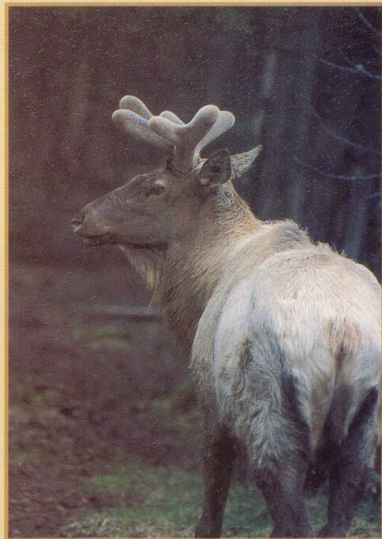
La croupe blanche d'un wapiti curieux