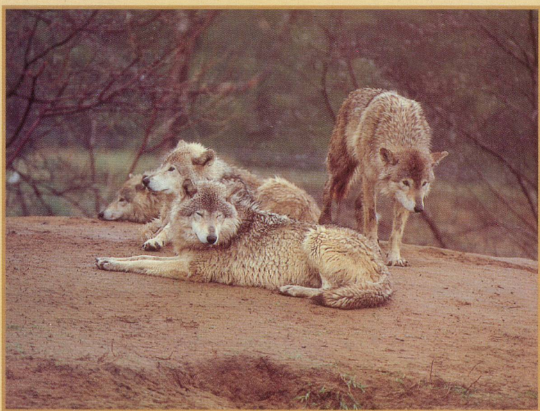
Une meute de loups, superbes et indifférents