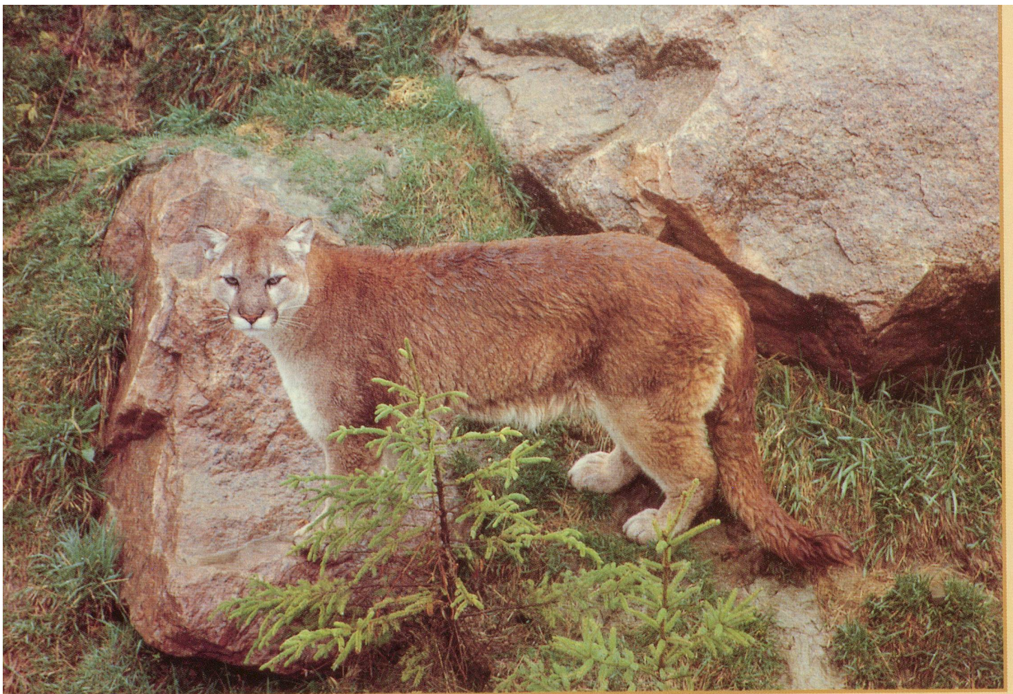
Un cougar, très à l'aise dans les rochers