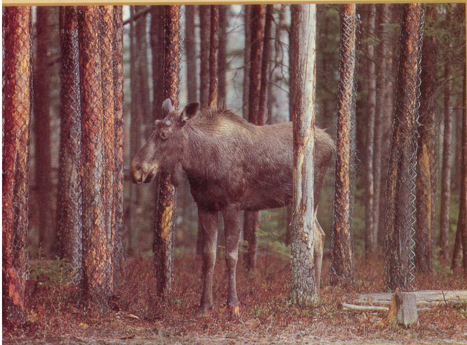
Un jeune orignal dans une forêt boréale