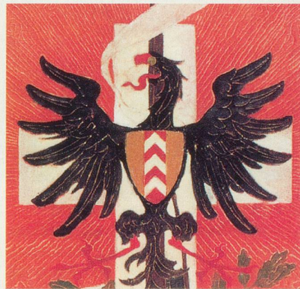
L'origine des chevrons remonte au Moyen Âge

(Réd.) L'ancien écusson aux chevrons était l'emblème de la famille des comtes de Neuchâtel. Il apparaît au 14 e siècle, à l'époque du comte Rodolphe IV. Il a été remplacé par le drapeau actuel, vert, blanc, rouge, le 11 avril 1848.