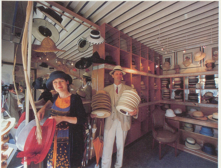
M. et M me Curchod offrent un grand choix de chapeaux pour chaque saison

Boutiques «Coup de chapeau», pl. Benjamin-Constant 1, à Lausanne et 6ter, rue de la Cité à Genève.