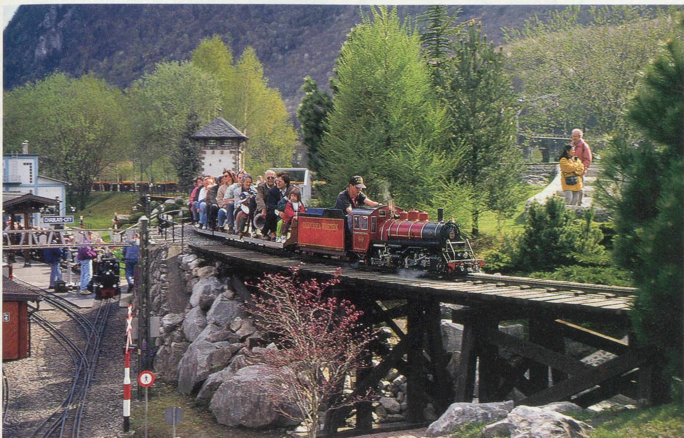
Au Swiss Vapeur Parc du Bouveret, les trains miniatures sont pris d'assaut tant par les petits que par les grands

Pringy, puisqu'on fabrique encore ici le fromage au feu de bois et à la force du poignet. Tous les ustensiles d'antan témoignent de la tradition des armaillis. Là aussi une présentation audiovisuelle vous apprendra tous les secrets de la pâte dure, mais eux aussi ceux de la salaison fumée et autres produits de la borne. Et, sur place, on peut déguster toutes ces alléchantes spécialités, de la crème double aux meringues en passant par le jambon fumé. De bonnes calories après l'effort de la promenade. Si les petits se sont lassés des dégustations de fromage, ils ne seront pas déçus par l'impressionnant toboggan-bob de Moléson. Les luges, tractées par un remonte-pente, dévalent la pente dans une sorte de piste de bob en plastique. Les grands-parents audacieux peuvent s'y risquer. Pour les plus prudents, un mini-golf agrémenté d'une buvette amusera sans péril toute la famille.