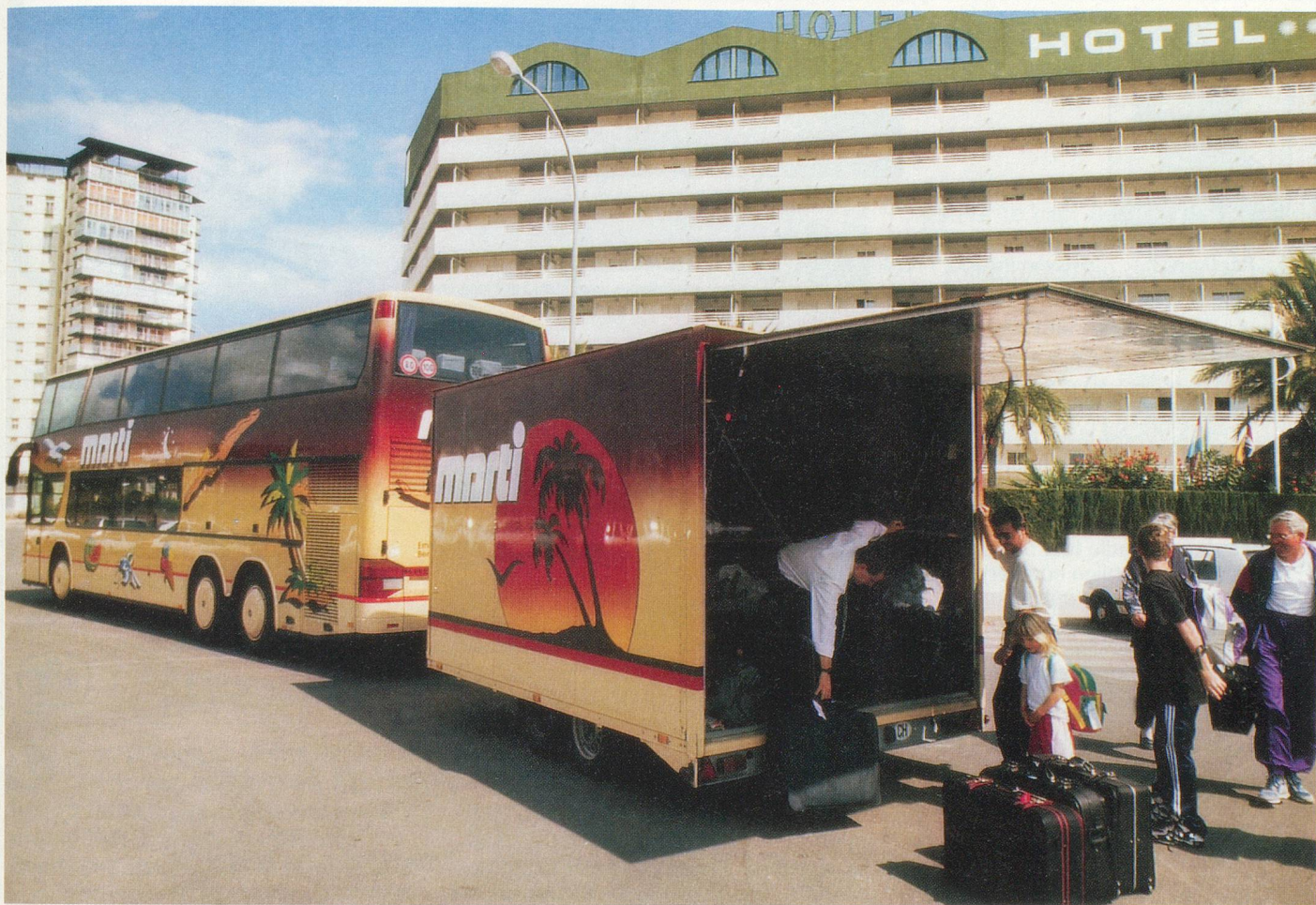
De nombreux seniors préfèrent le car pour voyager à l'étranger