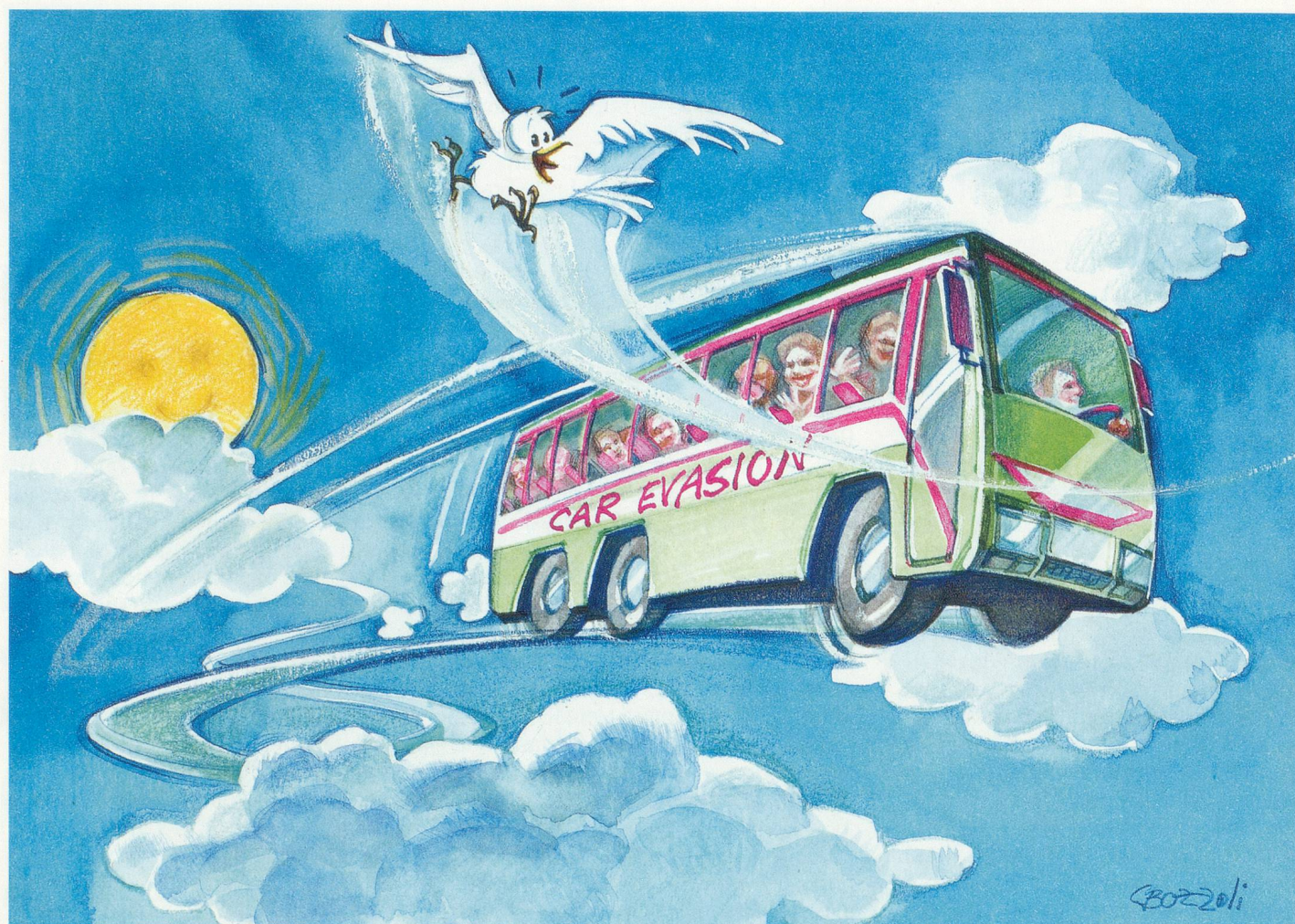
Dessin Cecilia Bozzoli

Les seniors aiment l'autocar qui les emmènent, pour un jour ou une semaine, vers l'évasion. Les bagages suivent, l'accompagnateur est là pour tous les petits tracas, mais surtout il y a de l'ambiance! Rencontre avec quelques habituées qui racontent leur bonheur de voyager.