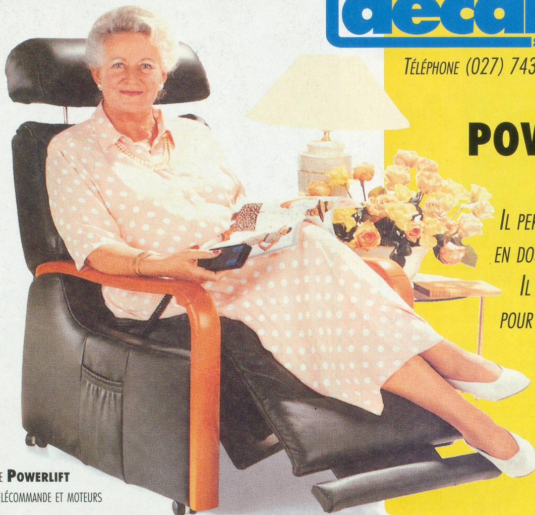
MODÈLE POWERLIFT AVEC TÉLÉCOMMANDE ET MOTEURS