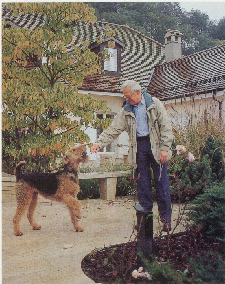
Sur la terrasse, devant la maison, avec son chien Ben

– J'ai commencé à faire des essais, des alliages et j'ai beaucoup travaillé le produit de base, la viande ou les poissons, servis avec des assemblages de légumes. Il fallait éviter que les goûts s'annulent ou se fassent concurrence, il fallait alléger les plats. J'ai passé des heures à