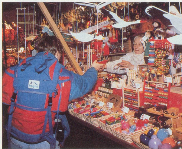
Le marché de Noël, une tradition alsacienne

Transfert en car de la Suisse et retour, logement en cabine double, extérieure, douche, WC, la pension complète, l'accompagnement d'un guide au départ de la Suisse. Le prix ne comprend pas les boissons et dépenses personnelles, les excursions facultatives, l'assurance annulation obligatoire.