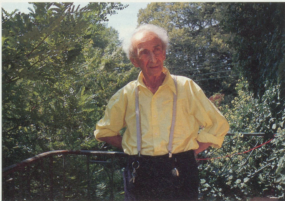
Son univers: une maison lézardée et un jardin extraordinaire