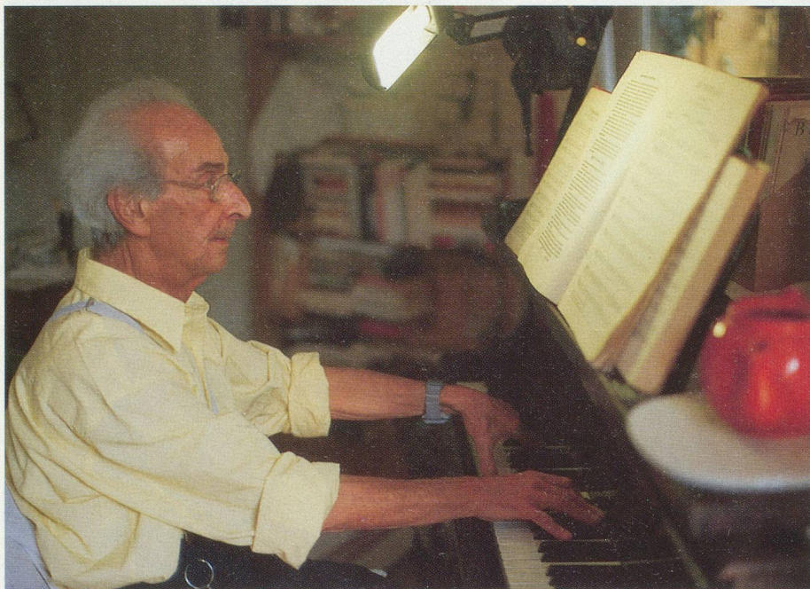
Il aime se détendre en jouant les œuvres de Delalande au piano