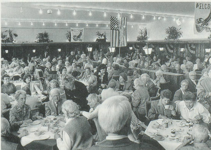
Les célèbres déjeuners - contact attirent des centaines de retraités

Vous pouvez obtenir des billets d'entrée au Comptoir suisse au prix de Fr. 5.- et des bons de réduction de Fr. 2.- sur le repas du 23 septembre en téléphonant à Pro Senectute, au 021/646 17 21.