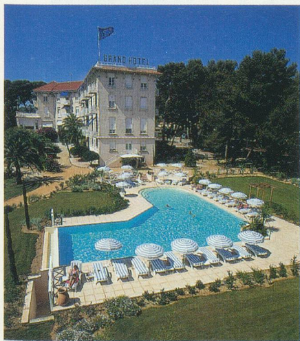
Le Grand Hôtel Les Lecques

Inclus dans le prix: transport en car, logement en chambre double, repas à Valence, pension complète, vin inclus, accompagnement dès la Suisse.