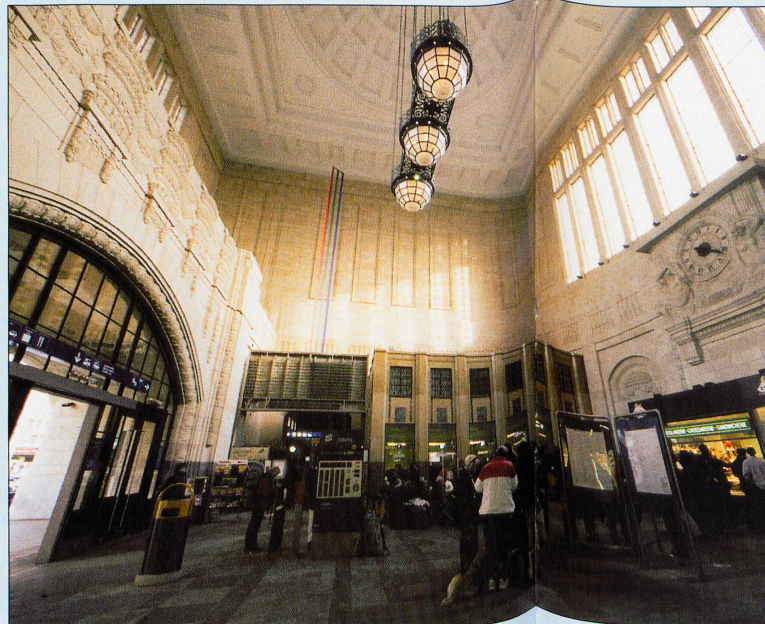
La gare de Lausanne, rénovée, sera inaugurée en avril