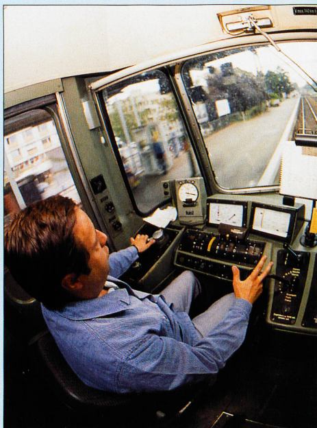
Dans la cabine de pilotage d'une locomotive moderne