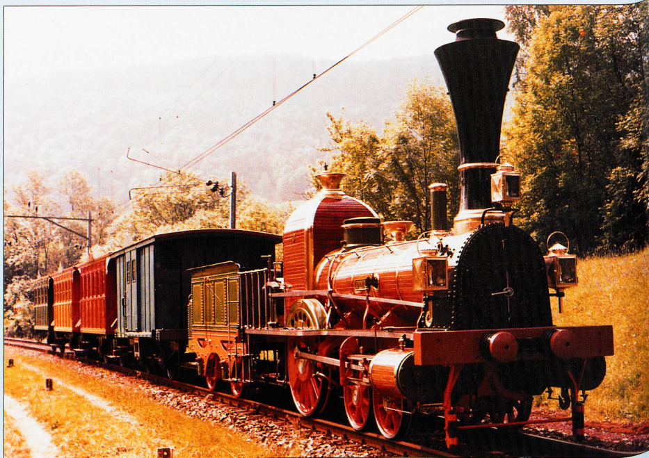
Le «Spanisch-Brötli-Bahn», mis en service en 1847