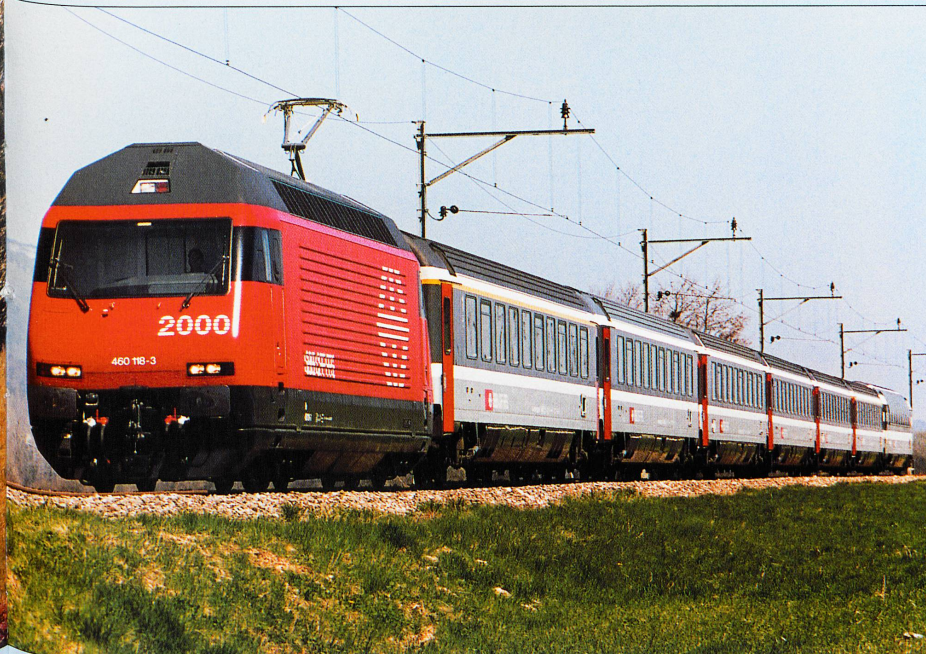
Une composition EuroCity, dernière-née des CFF