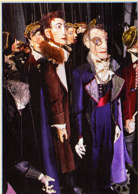
Un groupe de personnages inanimés, en quête d'une âme