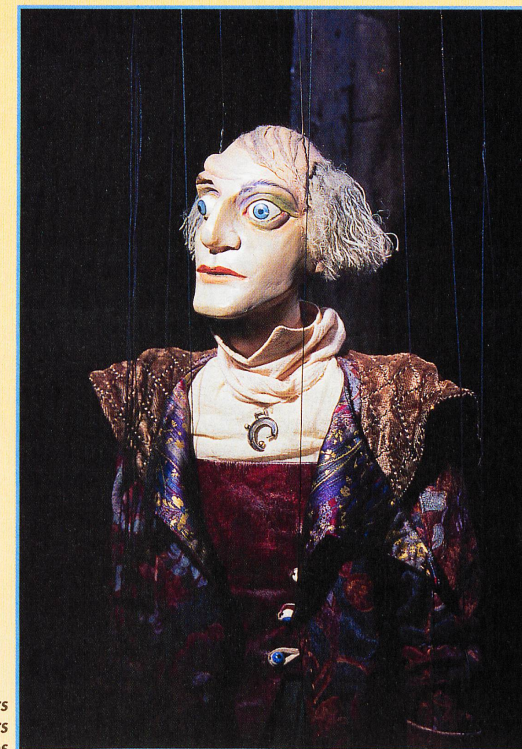
Ce sont des sculpteurs et des costumiers qui créent les poupées