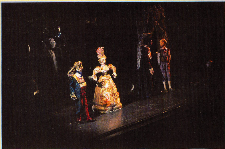
Une scène des «Contes d'Hoffmann» de Jacques Offenbach