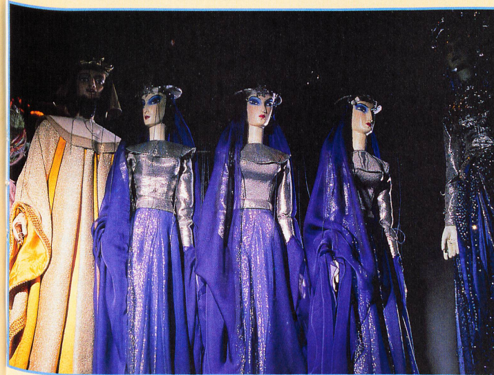
Un étrange ballet, suspendu aux cintres, attend son entrée en scène