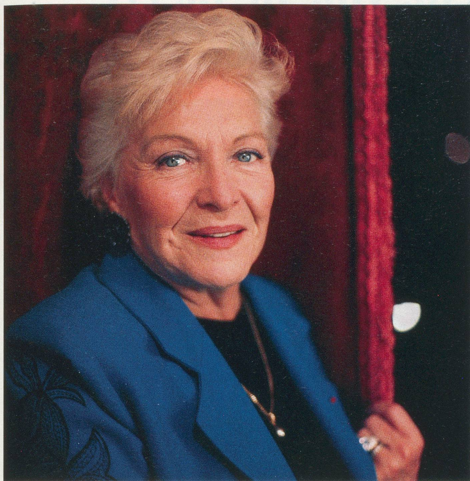
Un regard bleu profond, où alternent la joie et la mélancolie

quoi j'irais arrêter cette énergie. Ce serait un crime de me forcer à freiner une énergie naturelle.