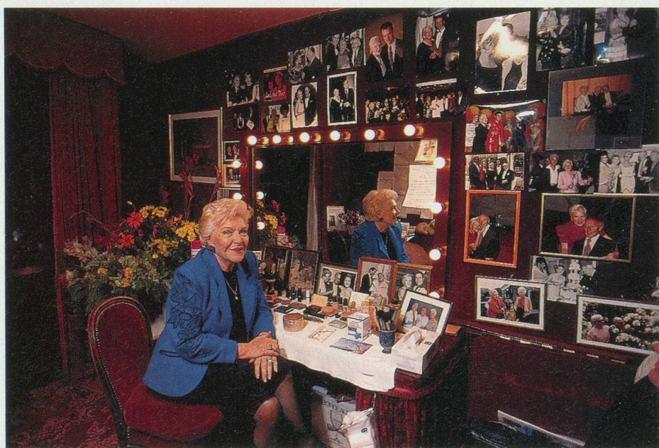
Line Renaud dans sa loge, entourée des portraits de ses amis du monde entier

– Rien n'est facile. Les choses ne viennent pas facilement à vous, il