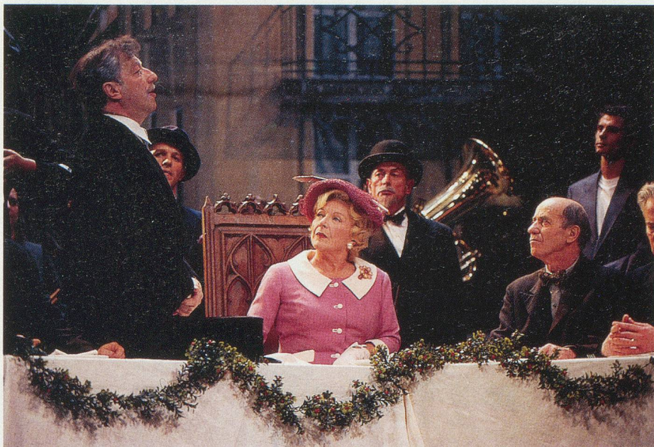
Sur la scène du Palais-Royal, La Vieille dame fait part de son terrible projet

– Tout. Il m'a tout appris. A 37 ans, il avait déjà vécu deux carrières au moins. Il avait joué dans le Jazz club de France, il jouait avec Django