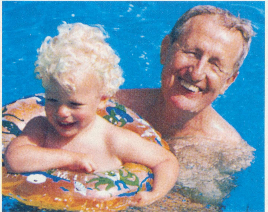
Emmener vos petits-enfants aux bains? C'est le succès assuré!