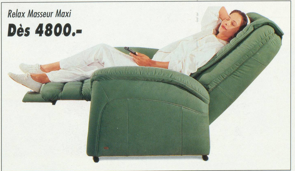
Relax Masseur Maxi Dès 4800.-