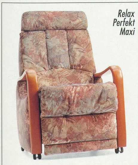
Relax Perfekt Maxi