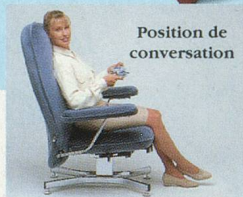
Position de conversation

LES ACCOUDOIRS ESCAMOTABLES, PRÉSENTS SUR TOUTE LA GAMME, VOUS PERMETTENT DE VOUS INSTALLER SANS LA MOINDRE GÊNE.