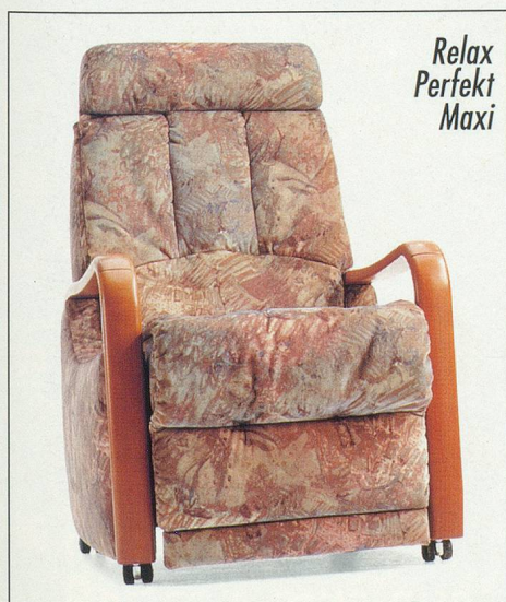
Relax Perfekt Maxi

Si vous désirez vraiment obtenir le meilleur confort, optez pour le RELAX Masseur Maxi. Il est doté de plusieurs programmes de massages, 3 sortes de massages et une unité de massage pour les jambes. Tout ceci à l'aide de sa télécommande.