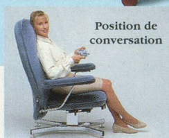
Position de conversation

LES ACCOUDOIRS ESCAMOTABLES, PRÉSENTS SUR TOUTE LA GAMME, VOUS PERMETTENT DE VOUS INSTALLER SANS LA MOINDRE GÊNE.