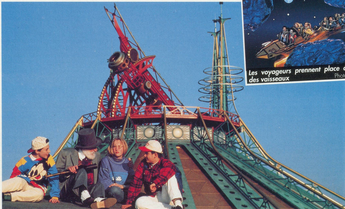
La montagne de l'espace, un hommage à Jules Verne