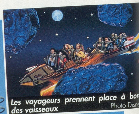
Les voyageurs prennent place à bord des vaisseaux

«Attention, la navette va décoller!» Le robot-pilote actionne un vo-