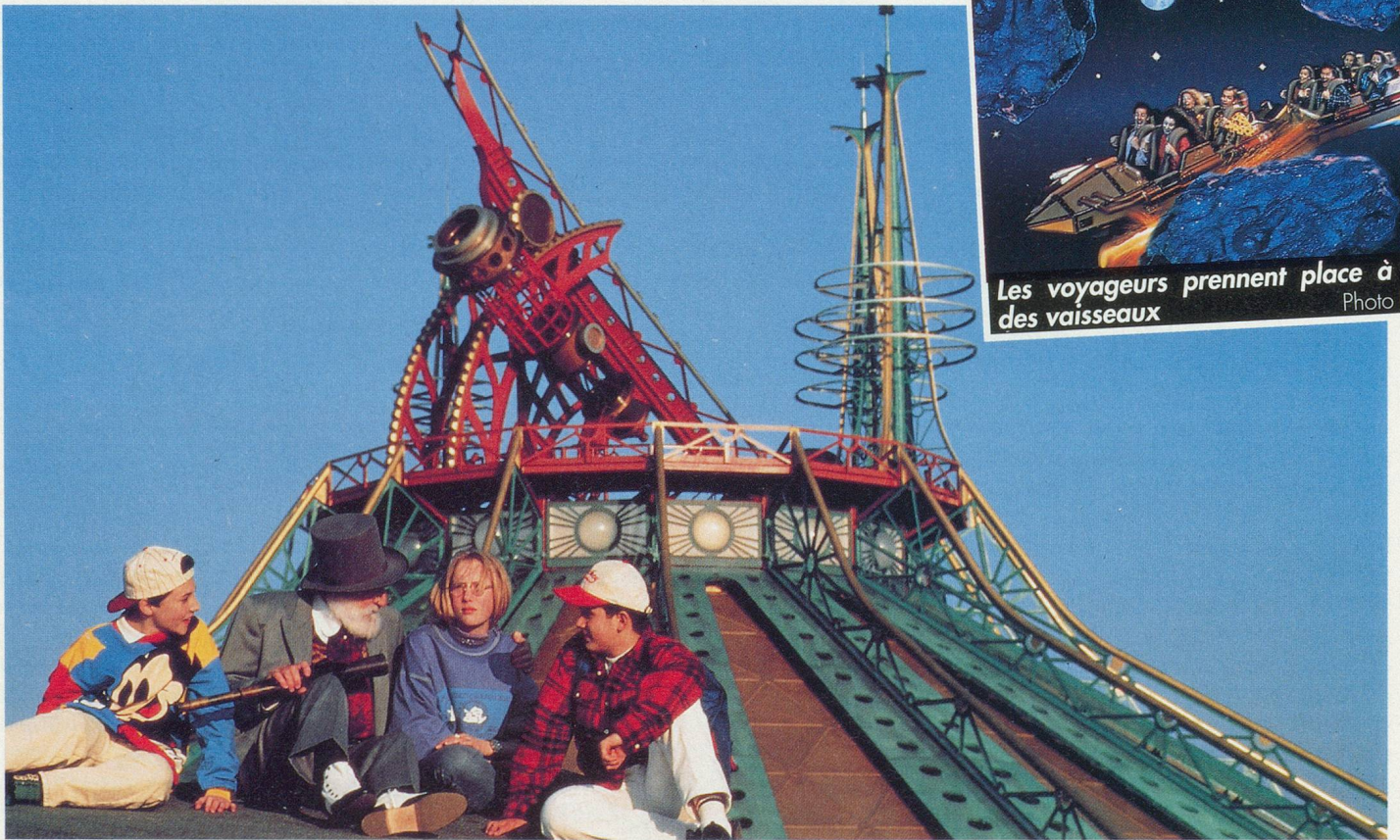
La montagne de l'espace, un hommage à Jules Verne