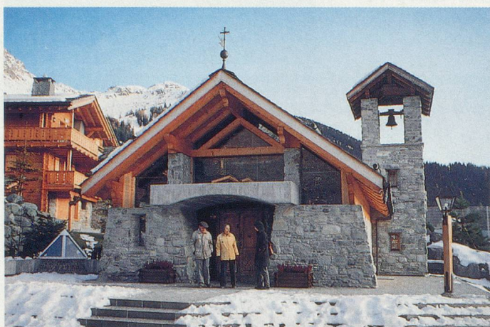
La chapelle de Tous-les-Saints, au cœur du Hameau