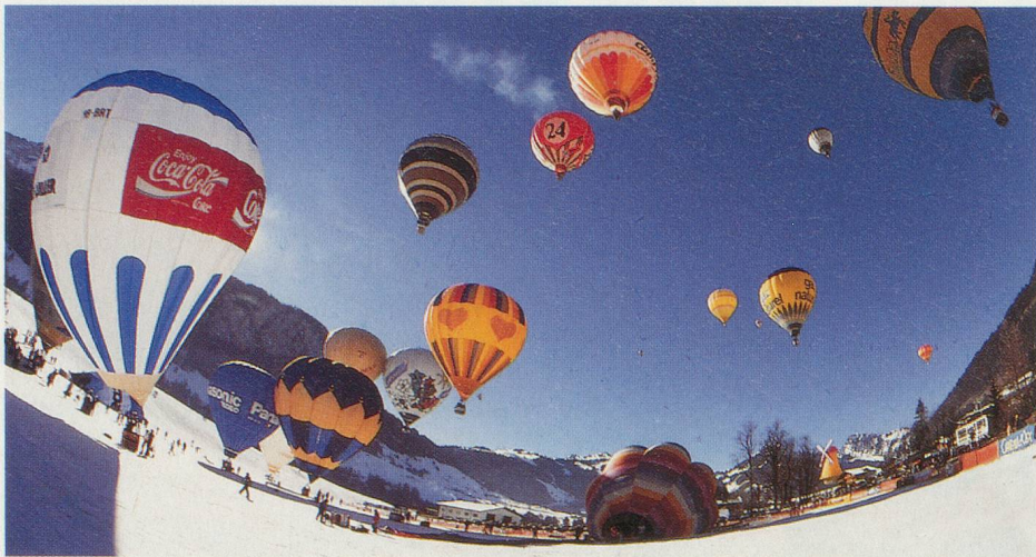
Château-d'Œx, rendez-vous des aérostats