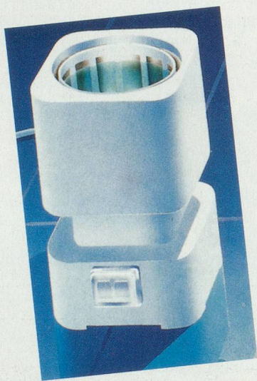
«Dentiquick», un nettoyeur à ultrasons

Cet appareil étonnant, baptisé «Dentiquick», est le seul appareil à