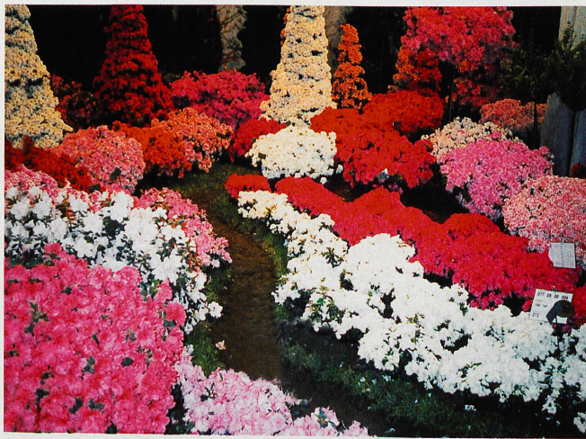
Les parterres de fleurs éclatent en une gerbe de couleurs superbes, qui séduiront les amoureux de la nature

Venus de tout le pays, mais également de dix villes françaises, de Thaïlande, de Malaisie et d'Indonésie, les spécialistes proposeront mille variétés de fleurs, parmi lesquelles des jacinthes, des gardénias, des roses, mais également des essences plus exotiques comme les bougainvillées, les hibiscus et les orchidées.