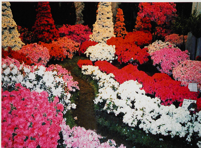
Les parterres de fleurs éclatent en une gerbe de couleurs superbes, qui séduiront les amoureux de la nature

Venus de tout le pays, mais également de dix villes françaises, de Thaïlande, de Malaisie et d'Indonésie, les spécialistes proposeront mille variétés de fleurs, parmi lesquelles des jacinthes, des gardénias, des roses, mais également des essences plus exotiques comme les bougainvillées, les hibiscus et les orchidées.