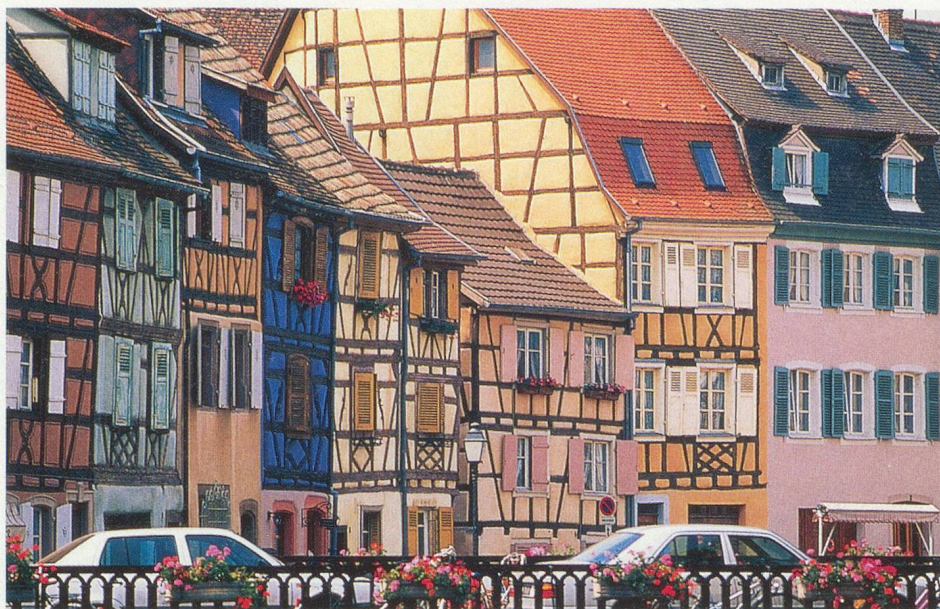
Au cœur du vieux Colmar, les maisons s'habillent de couleurs chatoyantes

Et puis, afin de mettre tout le monde d'accord, l'Alsace – et plus particulièrement Strasbourg – a choisi entre l'Allemagne et la France en devenant européenne, tout simplement.