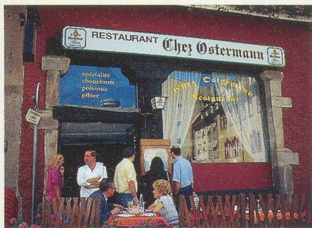
Des spécialités régionales chez Ostermann, dans la vieille ville de Mulhouse

Quelques kilomètres plus haut, en bordure de la route du vin, se trouve une étrange bâtisse en terrasse, agrémentée de tours crénelées. Constitué à l'origine par deux châteaux du 12 e siècle, le Haut-Kœnigsbourg a été restauré sous Guillaume II, avant de servir de décor, notamment, au célèbre film «La Grande illusion» de Renoir, qui mettait en présence Pierre Fresnay et Eric von Stroheim.