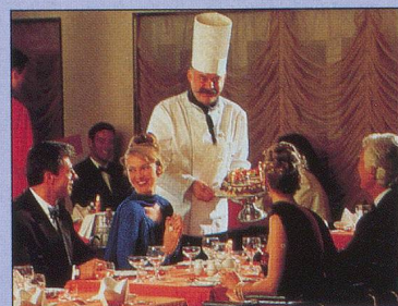
Les plaisirs culinaires...