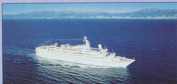
Votre "hôtel flottant", le ravissant MS BOLERO