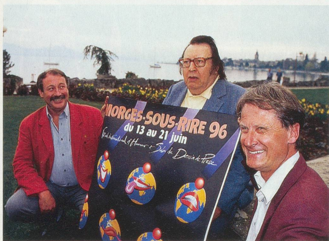
Raymond Devos, entouré des organisateurs du festival