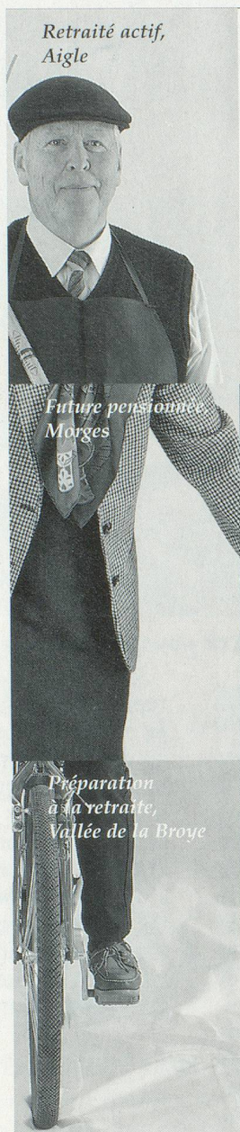
Retraité actif, Aigle