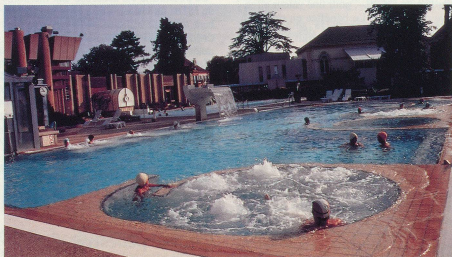
Le bassin thermal d'Yverdon-les-Bains