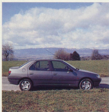
Une ligne très élégante...

deux mains sur le volant, ralentissements et accélérations se font sans agitation frénétique du bras droit et du pied gauche. On ne risque plus de caler parce que ça nous embêtait de rétrograder.