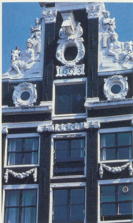
Une façade typique

monde, s'est opéré sans que la beauté de la ville et son ambiance si particulière aient à en souffrir le moins du monde. Amsterdam est belle et fière de l'être. Enumérer les attractions offertes par la ville serait fastidieux. Amsterdam est la ville de Rembrandt qui y a son musée installé dans la maison qu'il habita.