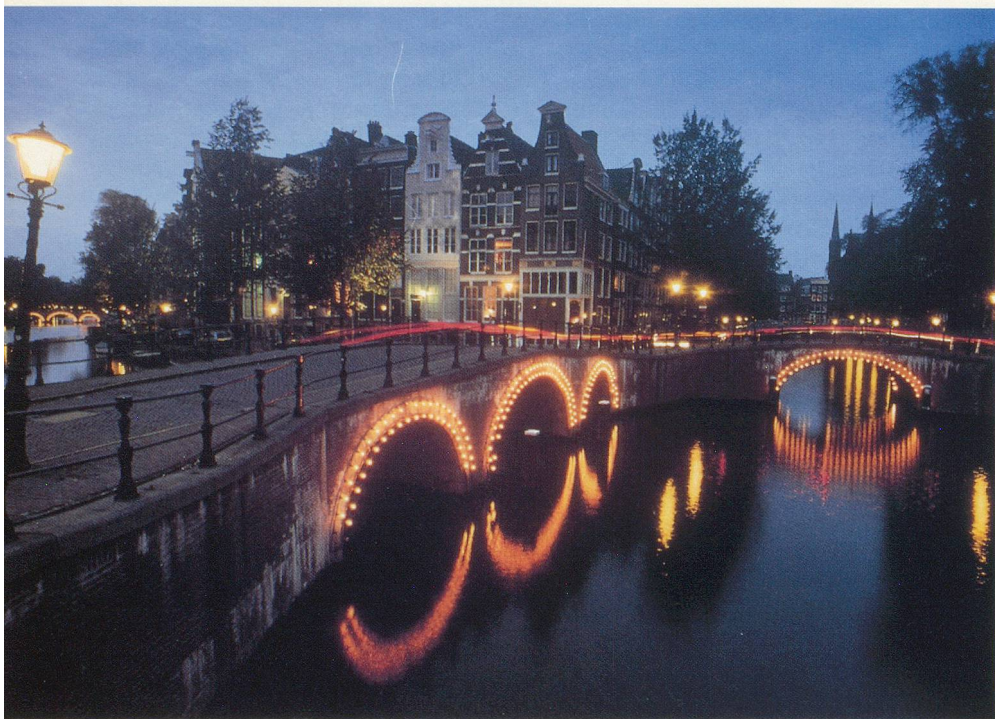
De nuit, Amsterdam est féérique

Autant l'avouer; j'aime Amsterdam. Je l'aime, je l'admire, je ne m'en lasse pas. Comment résister à sa séduction; comment ne pas ressentir profondément sa beauté, son climat de liberté, de tolérance? Il faut être bien balourd pour ne pas se laisser prendre au charme d'une ville qui, à chaque pas, raconte des histoires héroïques et d'incroyables défis?