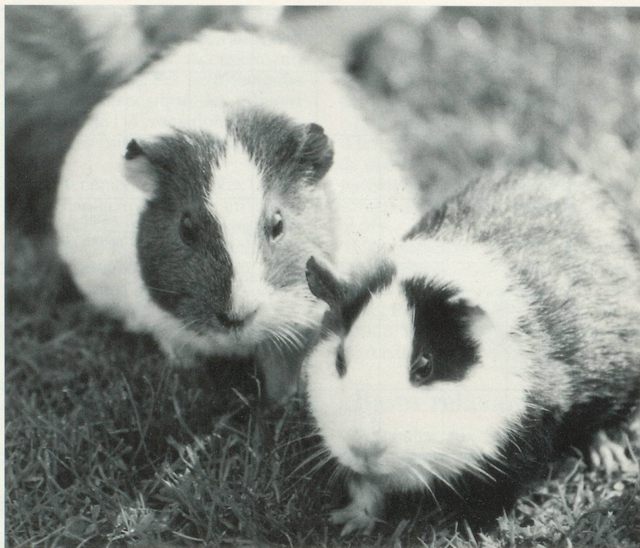
Les cochons d'Inde ne pensent qu'à ça!

L'autre souci du propriétaire sera de lui fournir une alimentation lui convenant. A savoir: foin sec, blé germé, carottes, betteraves, trognons de choux, etc. Pas de croûtons