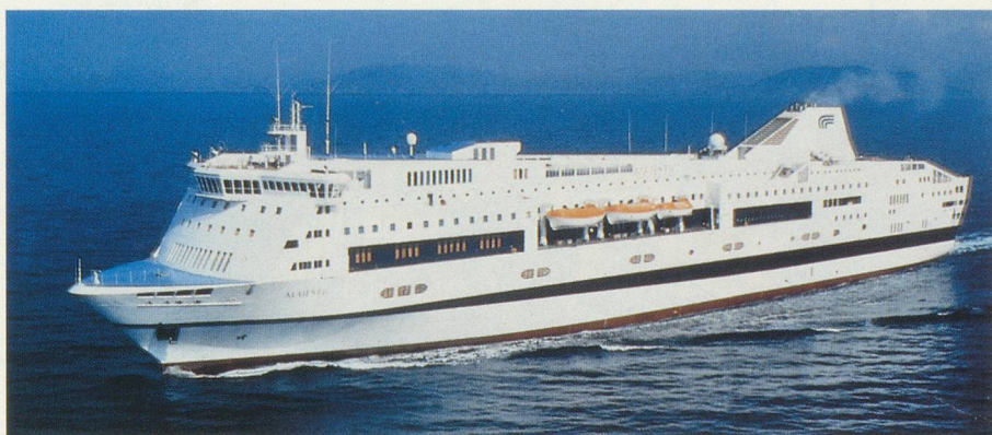
Le ferry M/S Splendid, un palace flottant

Une réduction est consentie aux personnes de plus de 60 ans, selon la cabine choisie.