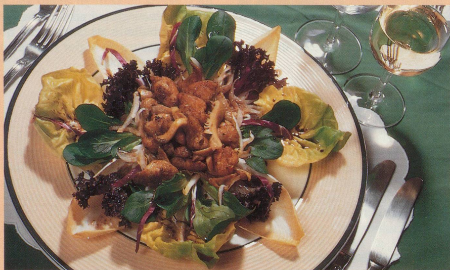
Ris de veau fondants et salade croquante

Servir avec un Pinot blanc sec. Bon appétit!