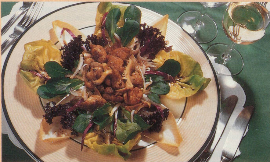
Ris de veau fondants et salade croquante

Assaisonner (sel et poivre), fariner légèrement et faire sauter les ris de veau au beurre dans une poêle à feu vif, jusqu'à ce qu'ils soient bien colorés. Au dernier moment, ajouter un peu d'échalotes et les pleurottes. Remuez une minute et dresser. Servir avec un Pinot blanc sec. Bon appétit!