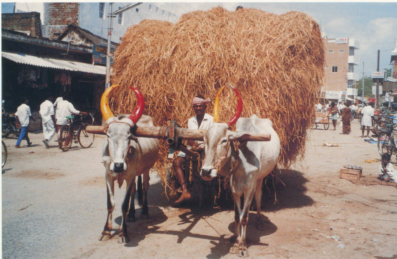
Les cornes des bœufs sont peintes en rouge et jaune pour porter bonheur

Au retour de mon voyage solitaire en Inde du Sud, mon amie Claire s'écria : «Mais tu as rajeuni de 10 ans!» A mon âge, cela remonte le moral! Ce fut en effet non seulement un voyage inoubliable, mais effectivement je n'étais plus la même au retour.