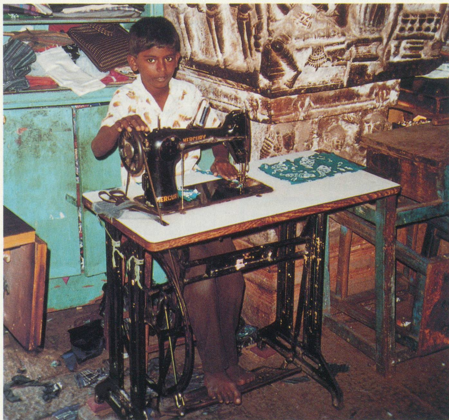
A Madurai, les enfants travaillent très tôt