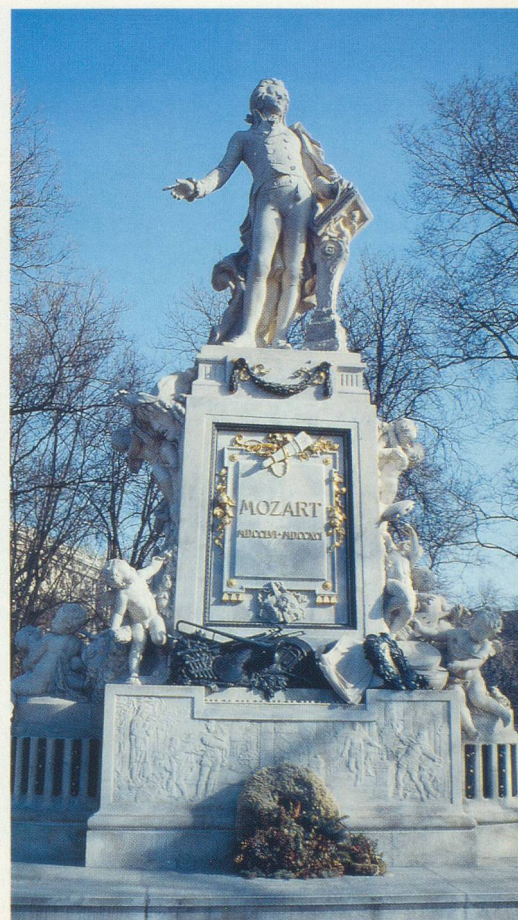
Mozart, immortalisé dans le Burggarten

Offre exceptionnelle du 29 décembre au 2 janvier