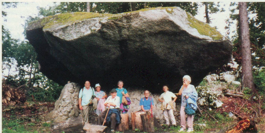
Les marcheurs à la découverte des blocs erratiques

«En forme après 50 ans», par Jean-Pierre Ernoul, Bayard Editions.