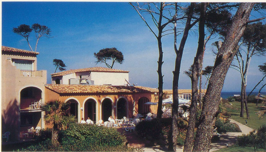
L'hôtel Ibis, dans une oasis de verdure

Profitez de l'offre qui vous est faite de bénéficier des bienfaits de la thalassothérapie à un tarif préférentiel et à une saison idéale. En collaboration avec «Génération», le centre Thalassa d'Hyères vous propose un forfait-santé pour une cure d'une semaine.