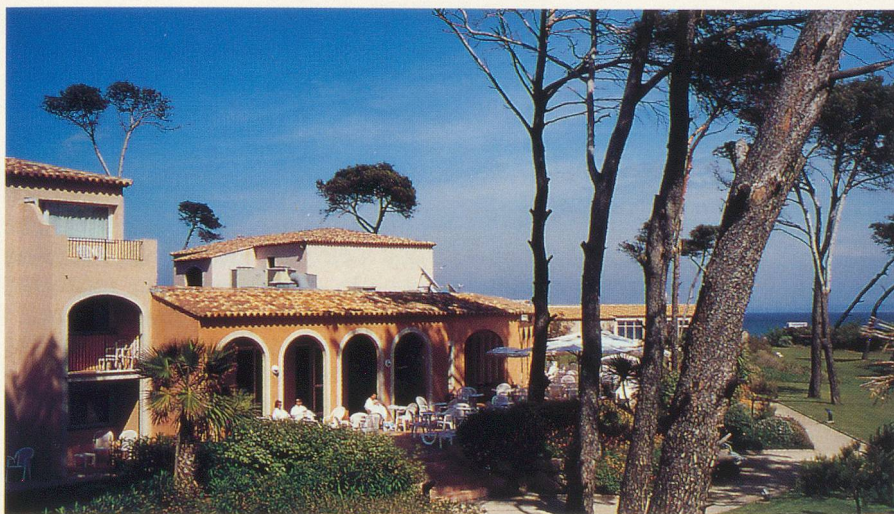
L'hôtel Ibis, dans une oasis de verdure

Profitez de l'offre qui vous est faite de bénéficier des bienfaits de la thalassothérapie à un tarif préférentiel et à une saison idéale. En collaboration avec «Générations», le centre Thalassa d'Hyères vous propose un forfait-santé pour une cure d'une semaine.