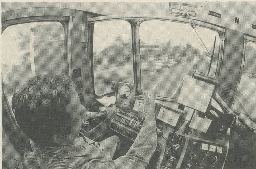
Le train pour un voyage rapide, sûr et confortable.

re inclus. Les prix pratiqués ne sont pas dissuasifs: à peine plus de mille francs pour une croisière de huit jours, pension et vol compris (au départ de Zurich).