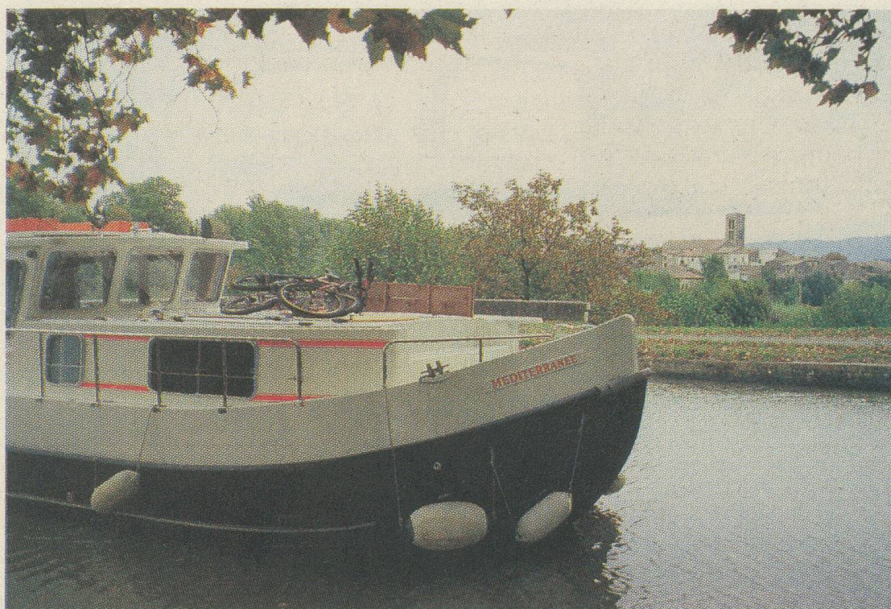
Capitaine d'une péniche au fil de l'eau...

Chaque année, les CFF proposent un certain nombre d'excursions accompagnées (renseignements dans toutes les gares de Suisse). En outre, les agences