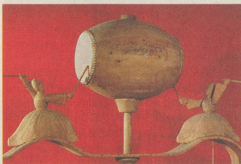
Détail d'un odomètre, qui servait à mesurer les distances.