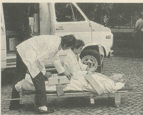
En cas d'infarctus, l'alarme rapide des secours est vitale.

A ssurant la circulation du sang dans l'organisme, le cœur est lui-même nourri par les artères coronaires. Qu'un petit caillot de sang bouche une coronaire déjà rétrécie et c'est l'infarctus du myocarde - plus couramment appelé infarctus - qui peut mener à l'arrêt cardiaque, potentiellement mortel. Aujourd'hui, des médicaments permettent de dissoudre le caillot coupable, augmenter ainsi les chances de survie du malade. Chances qui sont encore plus élevées si la dissolution a lieu dans l'heure - ou les deux heures - suivant le début des douleurs. D'où l'importance d'une intervention rapide des secours.