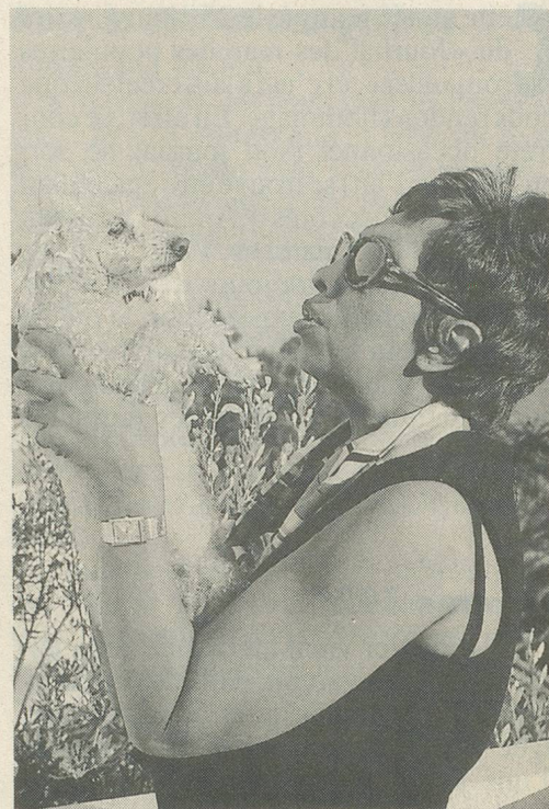
Joséphine Baker, une artiste exceptionnelle, doublée d'une femme exemplaire, avec un cœur d'or.

Elle est infatigable, increvable. Certaines critiques au vitriol ne ralentissent