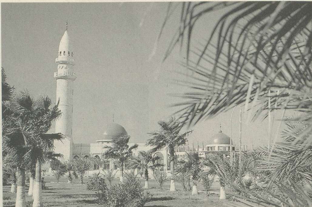
La flèche de la mosquée crèche le ciel d'Amman.

Lorsque les premiers voyageurs occidentaux s'enfoncèrent dans les contrées inconnues situées à l'est du Jourdain, ils furent tous frappés par la beauté et la diversité des paysages. Tout leur parut particulier: les montagnes