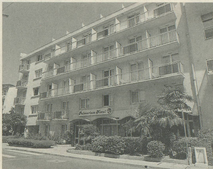
L'Hôtel Palmarium à Amélie- les-Bains

FF 50.-) et l'accompagnement d'un guide, sont comprises dans notre prix très avantageux de Fr. 1495.- par personne (pour ch. 1 lit, supplément Fr. 225.-)