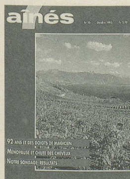
«Lavaux en octobre»