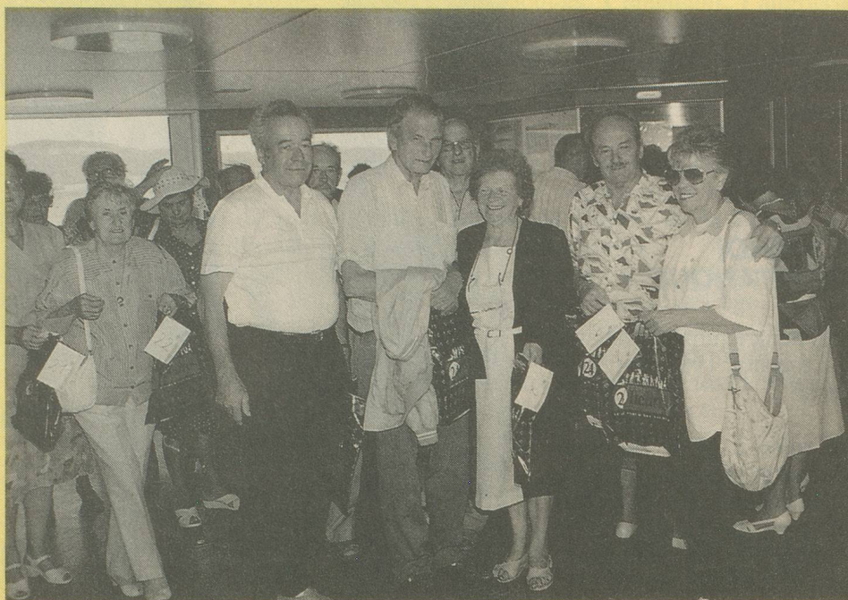
Les gagnants de la journée quelques instants avant de débarquer du bateau.

Renseignements et inscriptions au 021/36 17 21. Dès le 13 septembre, 021/646 17 21.