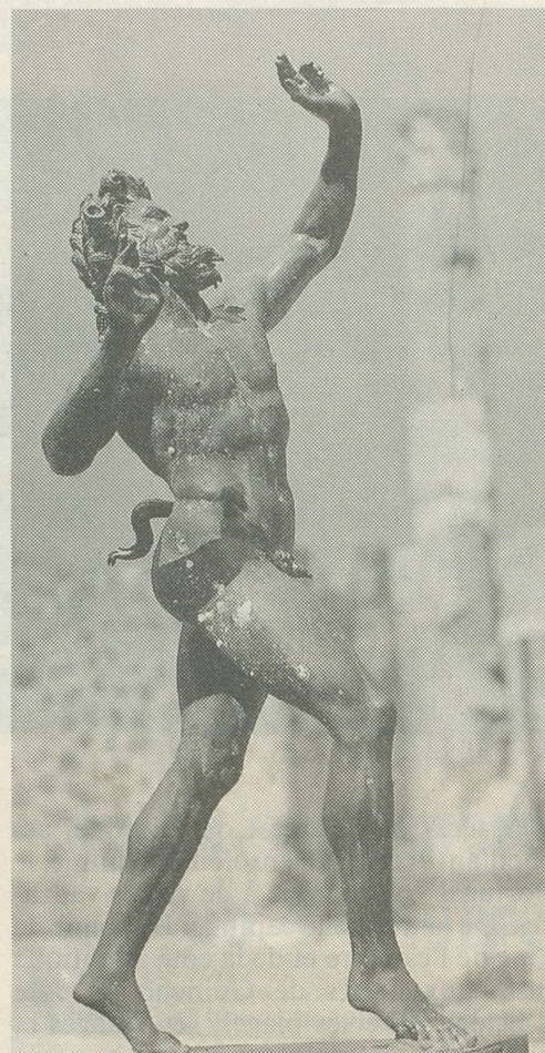
Des vestiges de la civilisation d'antan ont été découverts...

Thermalp les Bains d'Ovronnaz 1911 Ovronnaz Tél. (027) 86 67 67