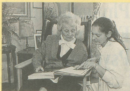
Réinventer de nouvelles formes de relation entre générations.