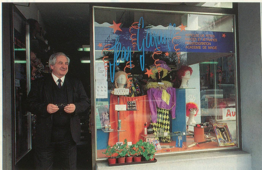
Une boutique, beaucoup de surprises: le Truc'Store.