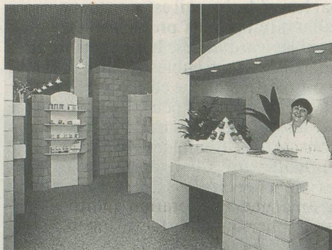
Dernière réalisation de la Fondation: la succursale d'Yverdon.

Acheter un appareil acoustique n'est pas toujours chose facile. Il est important d'être conseillé, de connaître les différents modèles existant sur le marché. Pour ce faire, depuis 1980, il existe une Fondation centrale SRLS (Société romande pour la lutte contre les effets de la surdité), qui possède huit centrales autonomes, à Fribourg, Genève, Lausanne, Neuchâtel, Sion, La Chaux-de-Fonds, Yverdon-les-Bains et Bulle. Cette Fondation s'occupe également des malentendants et, en plus des conseils, procède à l'établissement des formules souvent fastidieuses destinées aux instances sociales (AVS, AI, etc...). La SRLS remplit son rôle de Société d'aide aux durs d'ouïe par l'organisation de cours de lecture labiale, le subventionnement d'installations de boucles magnétiques dans les lieux publics, apporte une aide financière pour l'acquisition d'appareils acoustiques à des enfants ou à des rentiers AVS de condition modeste. Cette fondation vend une large gamme d'appareils. Les bénéficiaires des centrales sont mis à la disposition de la SRLS pour assumer les différentes tâches dont elle a la charge.