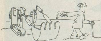
Sans paroles. Dessin de Biret, Cosmopress Genève.