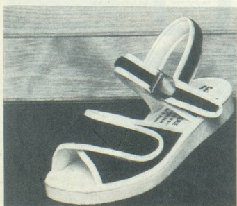
STAR N°1 Marine Fr. 74.-