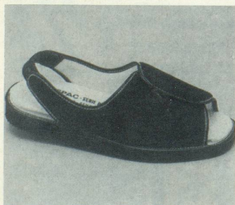
FORMEN N°1 Marine Fr. 77.-

(Veuillez indiquer le nombre de paires dans les cases correspondantes, s.v.pl.)