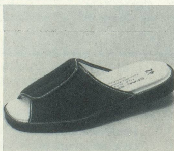
FORMEN N°2 Marine Fr. 73.-