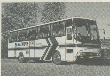
Le car qui vous emmènera sur les hauteurs de la station