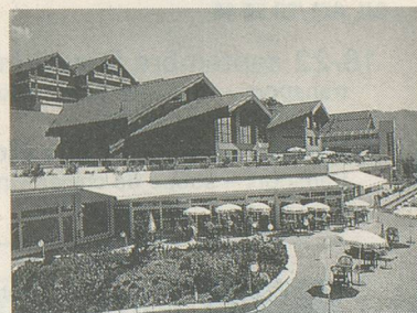
Le centre thermal d'Ovronnaz